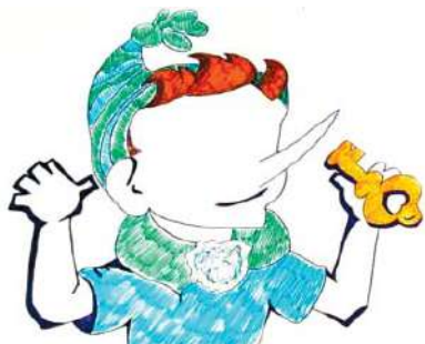
Рис. П2.3. Пример «Буратино»